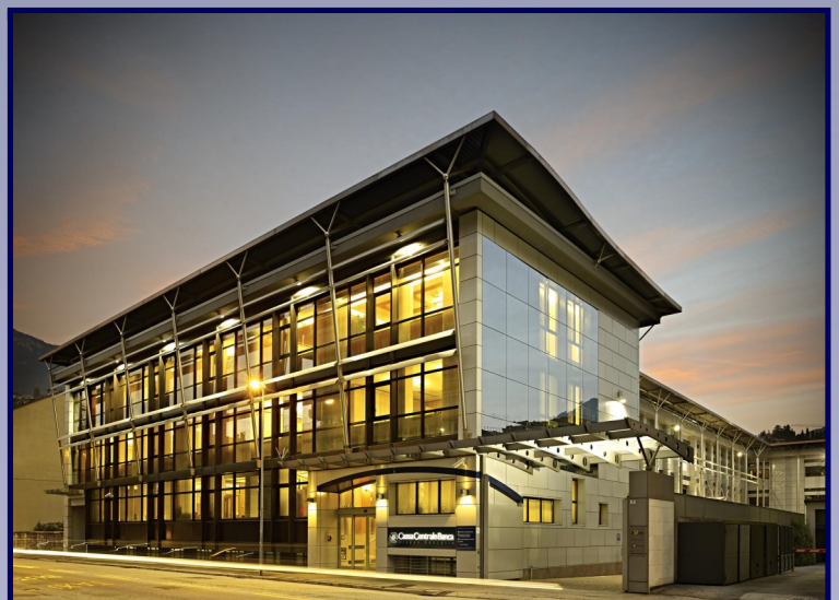
La Sede di Trento di Cassa Centrale Banca