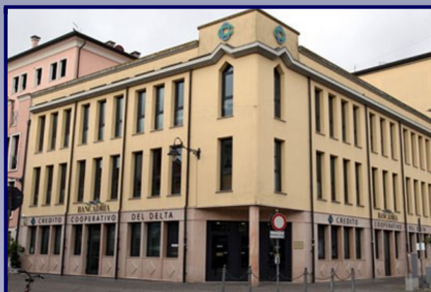
Ad Adria sarà ubicata la Sede legale e direzionale

Patrimonio di Vigilanza CET1 pari a circa 113 milioni di € con CET1 ratio al 15,51%