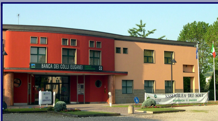
A Lozzo Atestino saranno ubicati alcuni servizi ed attività di back office