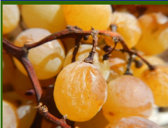
"Appassimento del "Fior d'arancio"