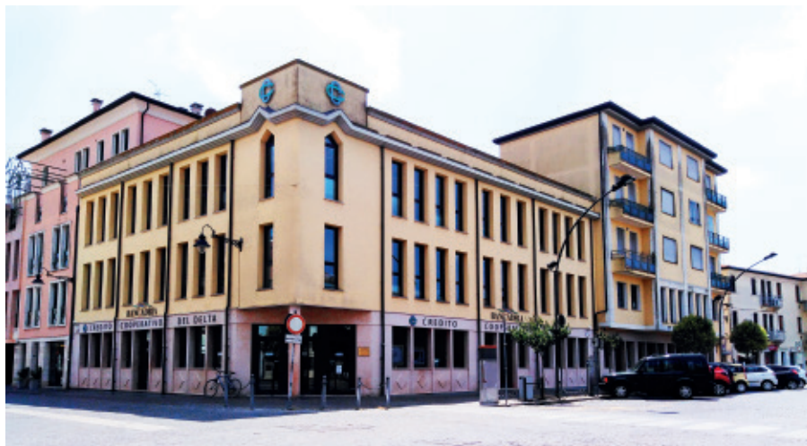
Sede Generale Banca Adria Colli Euganei Banca del Territorio e della Comunità