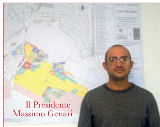
Il Presidente Massimo Genari

R. Il Consorzio si occupa di tutte le fasi della filiera della molluschicoltura, dalla produzione alla commercializzazione. La nostra è un'azienda in continua crescita, con un fatturato che negli ultimi anni è aumentato considerevolmente e nel 2018 si è attestato sui 53 milioni di Euro, valore che sarà riconfermato anche nel 2019. Una ulteriore evoluzione consiste nell'essere passati concretamente da una pura pesca di allevamento ad una gestione completa delle risorse e dei processi. Infatti, alla semplice produzione dei molluschi